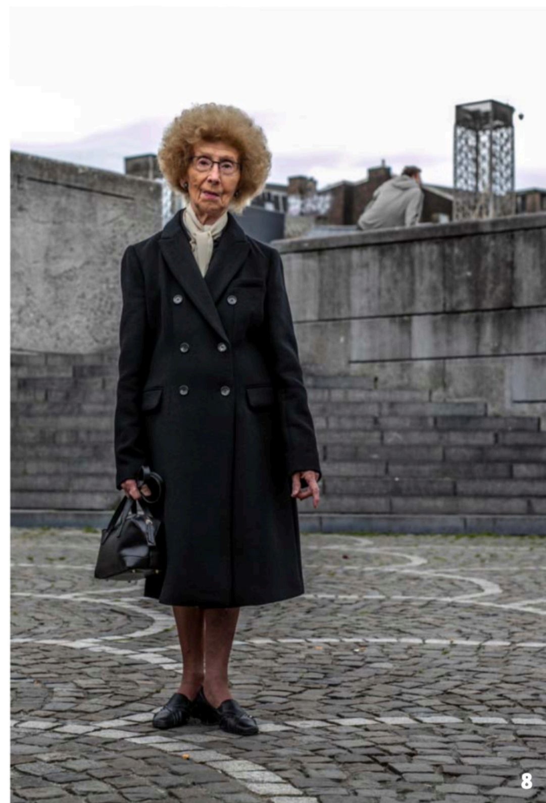
Foto 4: Turks-Koerdische vrouwen in een park in Droixhe (Luik). Foto 5: Uitzicht op de schacht van de Oranje-Nassau 1 in Heerlen. Het CBS vestigde zich na de mijnsluiting in Heerlen om vervangend werk te kunnen bieden aan mijnwerkers. Foto 6: Restant van de kolenwasserij van de steenkoolmijn van Cheratte bij Luik. Foto 7: Het verlaten Palais des Sports (1939) in de arbeiderswijk Coronmeuse bij Luik, met twee terrils op de achtergrond. Het gebouw was in gebruik als ijshockeybaan. Foto 8: Een vrouw op Place Saint Lambert in het centrum van Luik.